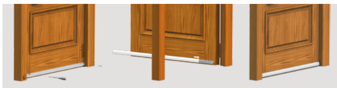
Applicazione sul lato esterno