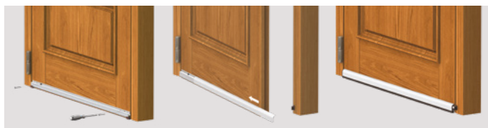
Applicazione sul lato interno

Meccanismo con una singola regolazione (vite F: discesa) caratterizzato dal movimento controllato del profilo mobile con guarnizione (discesa immediata dal lato cerniere della porta e conseguente discesa graduale per tutta la lunghezza) per un adeguamento al pavimento.